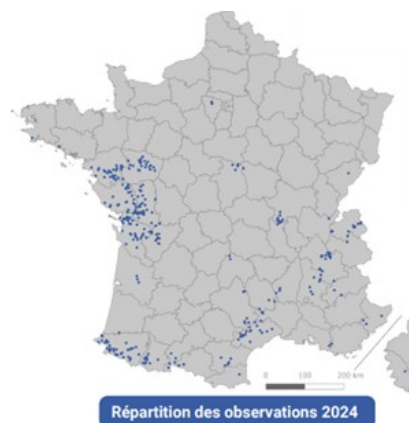
Répartition des observations 2024

Géographie locale : notre secteur peut s'enorgueillir de la présence de la Rosalie. En effet, l'existence des frênes têtards dans notre contrée constitue un habitat privilégié. Donc, si vous allez vous promener sur le bord de Loire entre l'île Olivier aux Rosiers et St Martin de la Place (de juin à août, par une belle journée chaude et ensoleillée), prenez le temps d'observer les frênes moribonds ou en décomposition ; si vous êtes attentifs et que vous avez un peu de chance, vous pourrez alors observer ce magnifique insecte.....et devenir contributeur aux sciences participatives via le site ici .