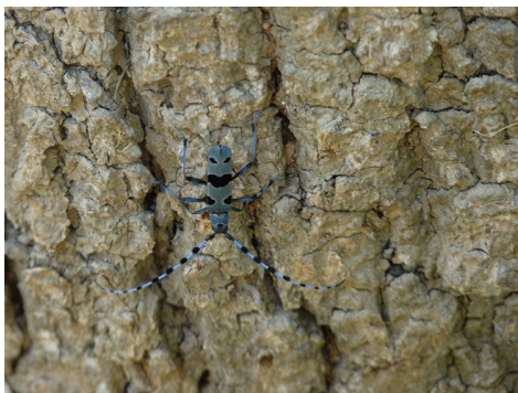
Rosalie débusquée à l'île Olivier des Rosiers

distincts : les hêtraies de montagne et moyenne montagne et les ripisylves (1) de plaine. Ce second habitat de plaine est parfois considéré comme une expansion liée à un